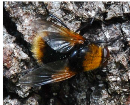
Jag är ingen humla. Jag är en jordhumlefluga

Tisdag 19 maj Tid kl 16-18. Mera liv i Täppan. Hur man gör sin trädgård mer attraktiv för vilda djur. Vilka växter gillar fjärilar och humlor? Varför är det bra med en rishög i en hörna? Stationer med olika teman tex.vildbin, småfåglar, lämpliga växter mm.Barnaktiviteter kl 17. Plats Habiteum. Hur man kommer dit kan du läsa under aktivitet KonsuMindre 18,19 februari. Arrangör Nsf och Miljöverkstaden Kontakt Christel Kvant 0702 200 878